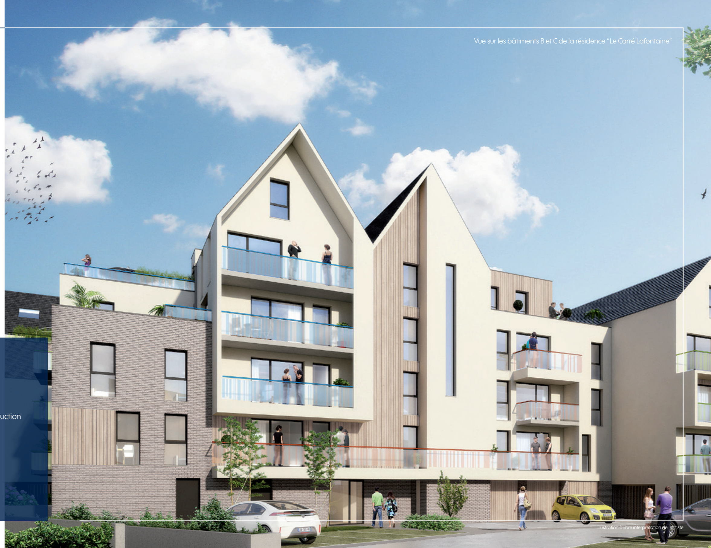
Illustration à libre interprétation de l'artiste

Vue sur les bâtiments B et C de la résidence "Le Carré Lafontaine"