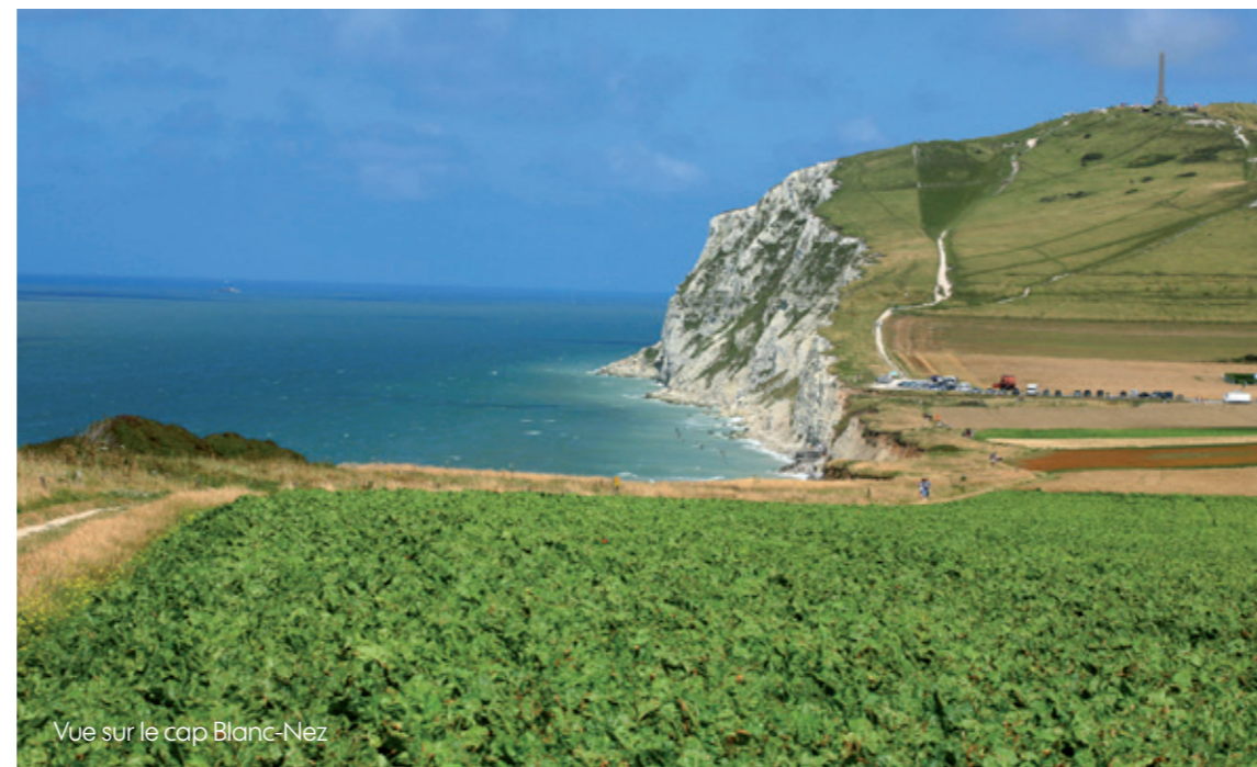
Vue sur le cap Blanc-Nez

▶ À quelques pas, le site des Deux Caps offre un environnement naturel exceptionnel. Distant l'un de l'autre de 5 kilomètres, le cap Gris-Nez et le cap Blanc-Nez forment la Terre des Deux Caps, faisant face aux côtes britanniques et dominant le détroit le plus fréquenté au monde.