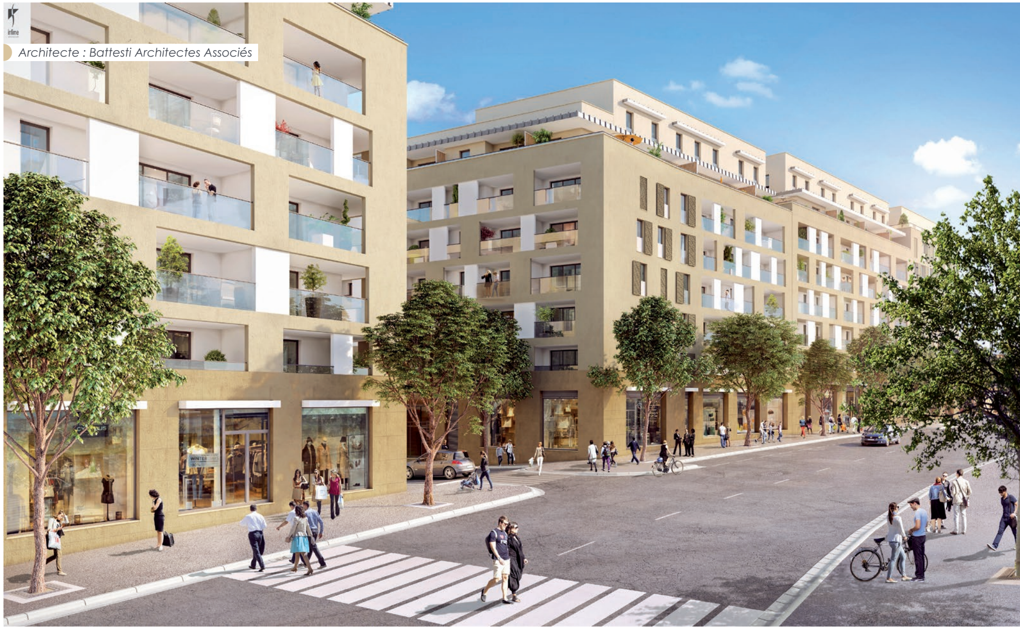
Vue depuis le boulevard Ferdinand de Lesseps

Architecte : Battesti Architectes Associés