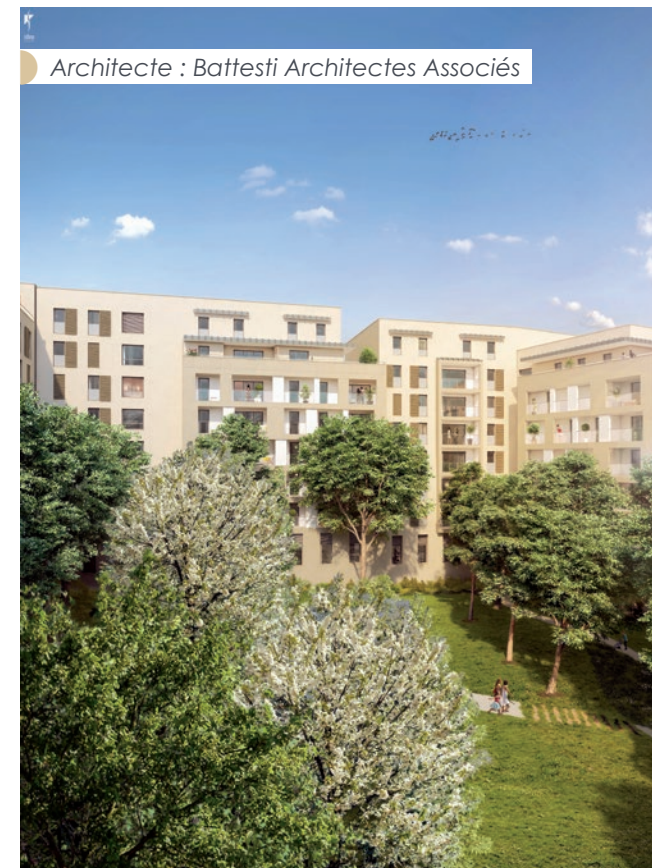
Vue depuis l'îlot central paysager

Perspective Intime. Illustration non contractuelle.