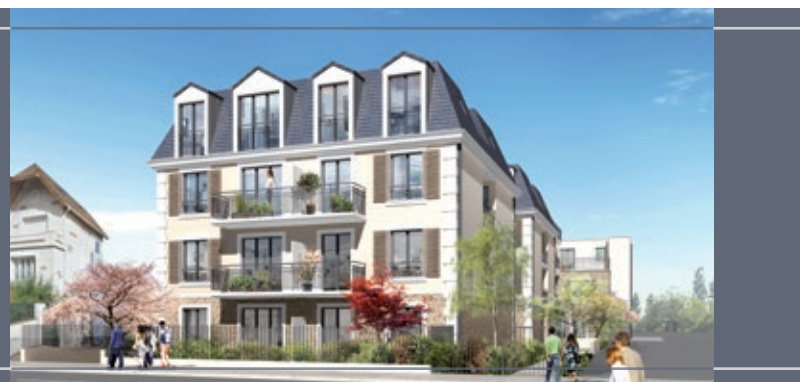
Illustration à libre interprétation de l'artiste