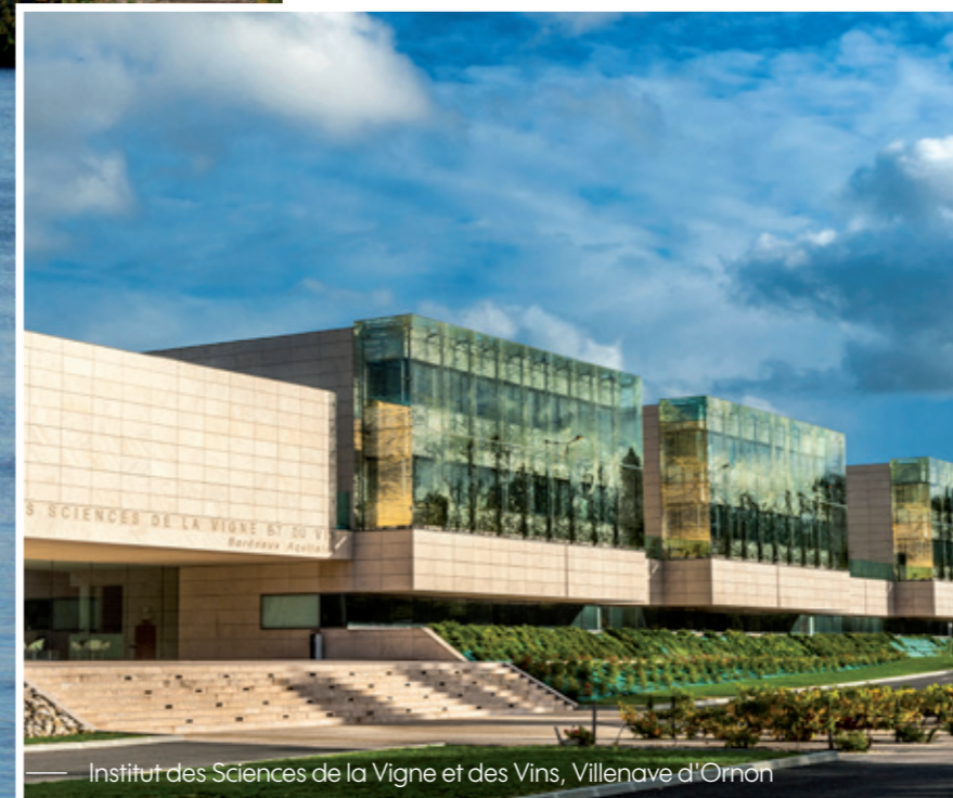
Institut des Sciences de la Vigne et des Vins, Villenave d'Ornon

► Villenave d'Ornon se singularise par sa tradition vinicole et les pôles de recherche agricole qu'elle abrite. Idéalement située à proximité des domaines universitaires Talence-Pessac, la ville, desservie par le tramway, s'inscrit dans le dynamisme de la zone commerciale des Rives d'Arcins qui la borde et du futur quartier d'affaires Bordeaux Euratlantique.