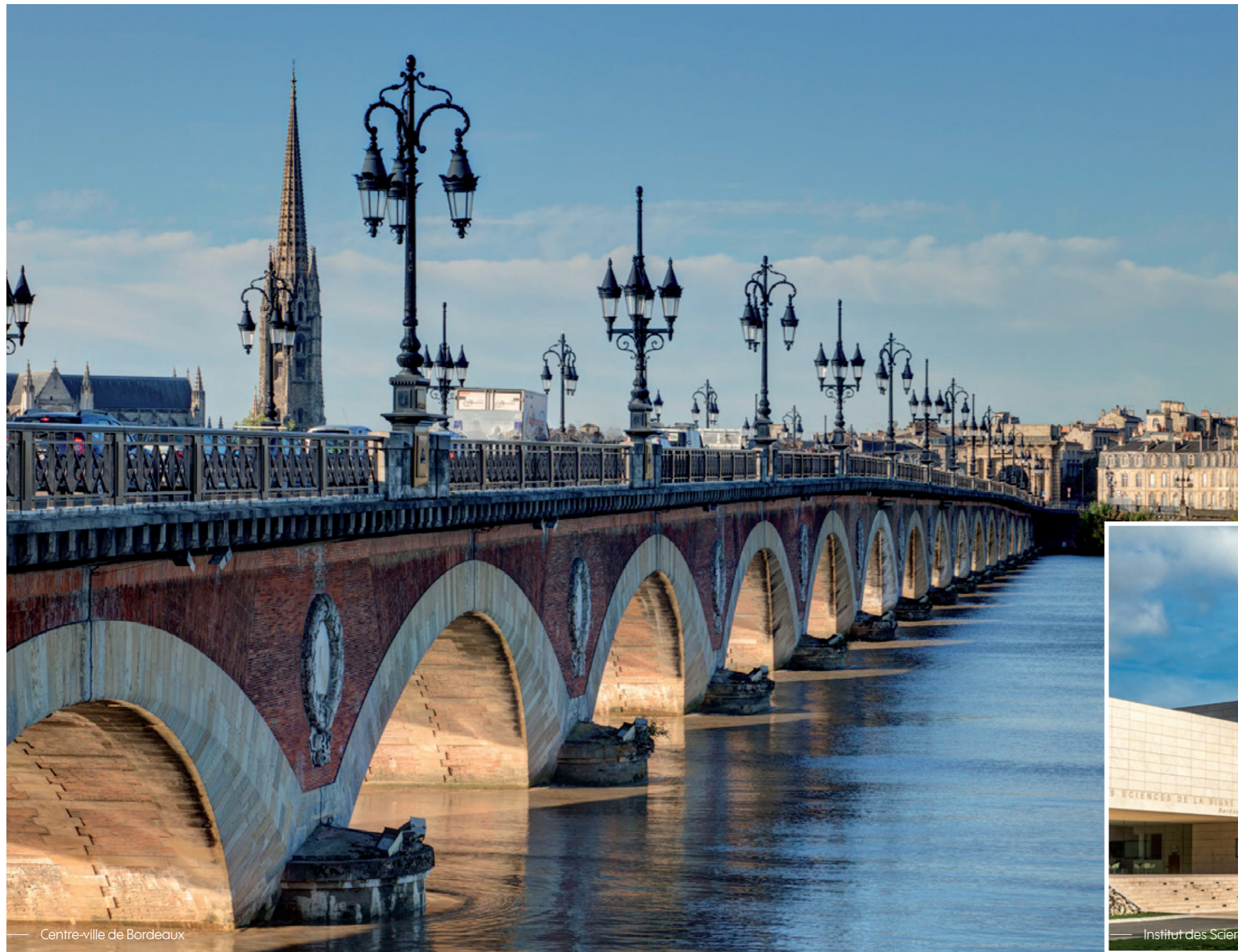
Centre-ville de Bordeaux