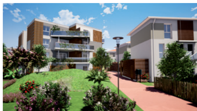
Illustrations à libre interprétation de l'artiste