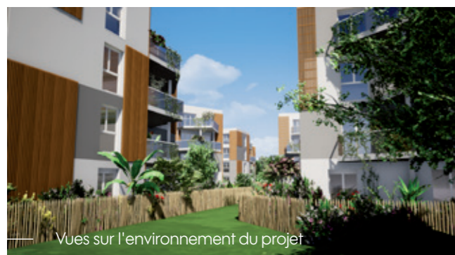
Vues sur l'environnement du projet