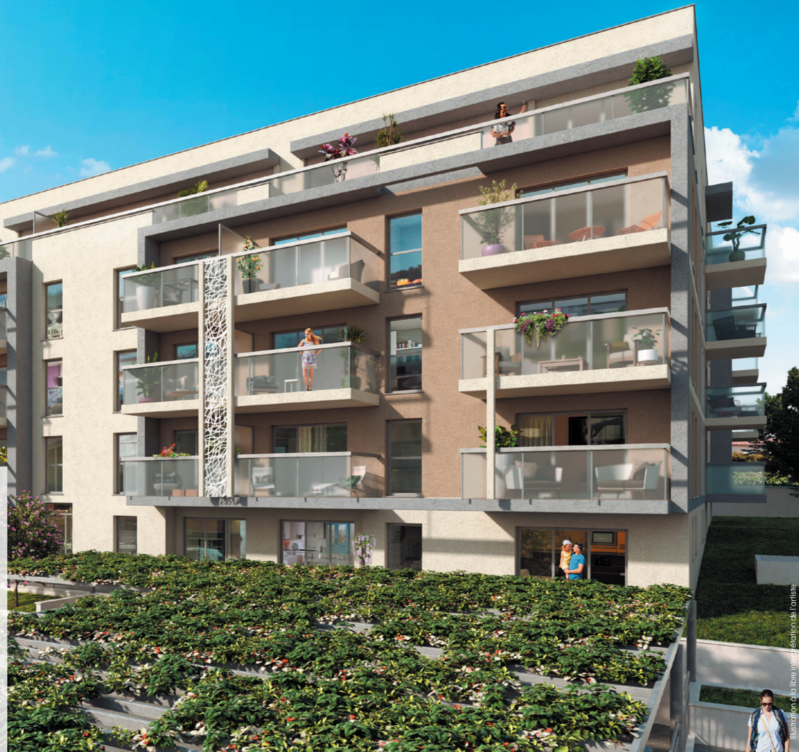
Illustration © La Libre Immatriculation de l'artiste