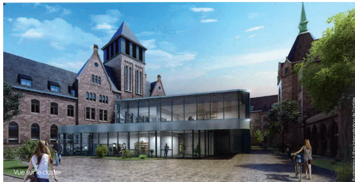
Vue sur le cluster

Illustrations à libre interprétation de l'artiste