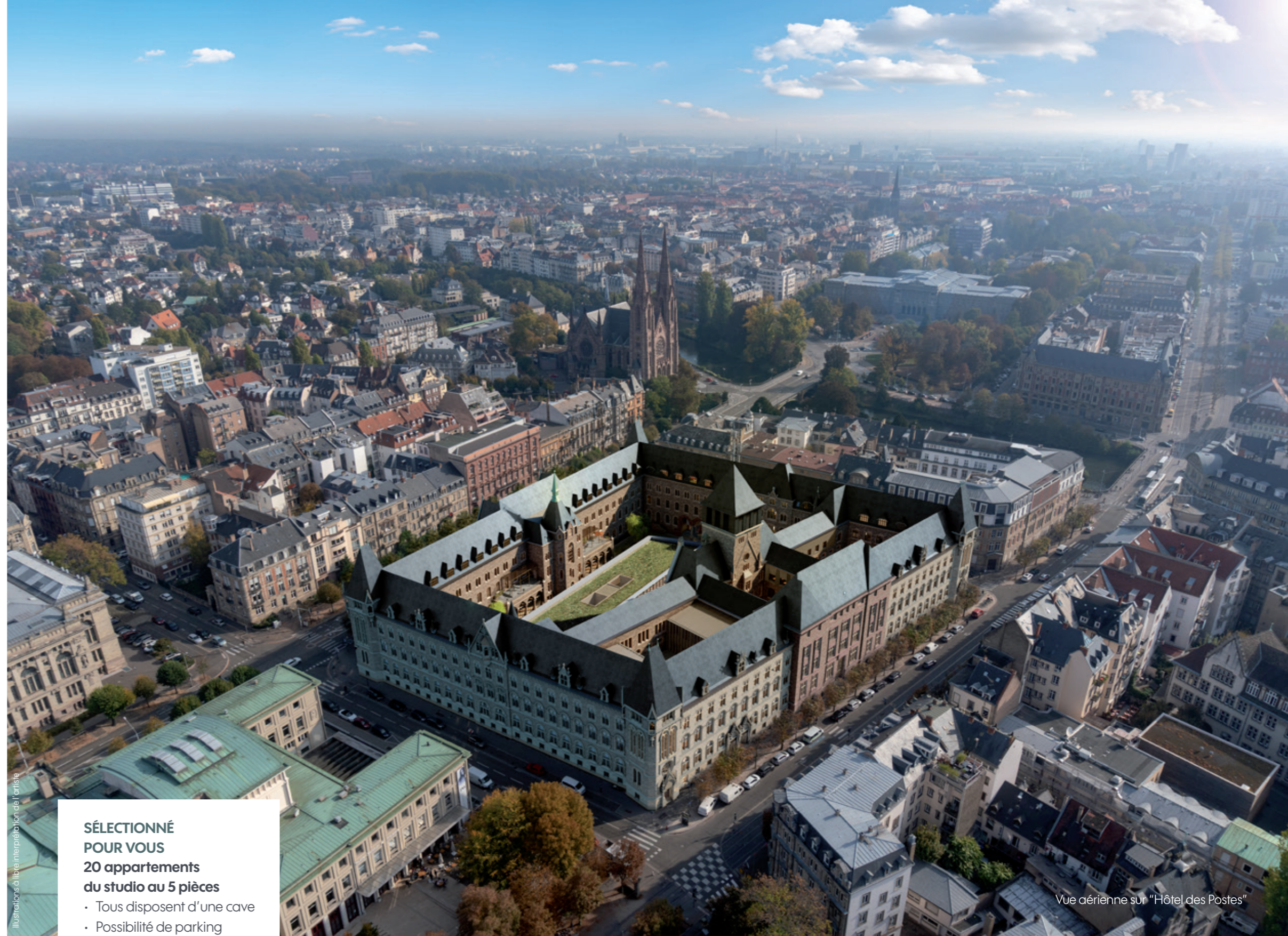
Vue aérienne sur “Hôtel des Postes”