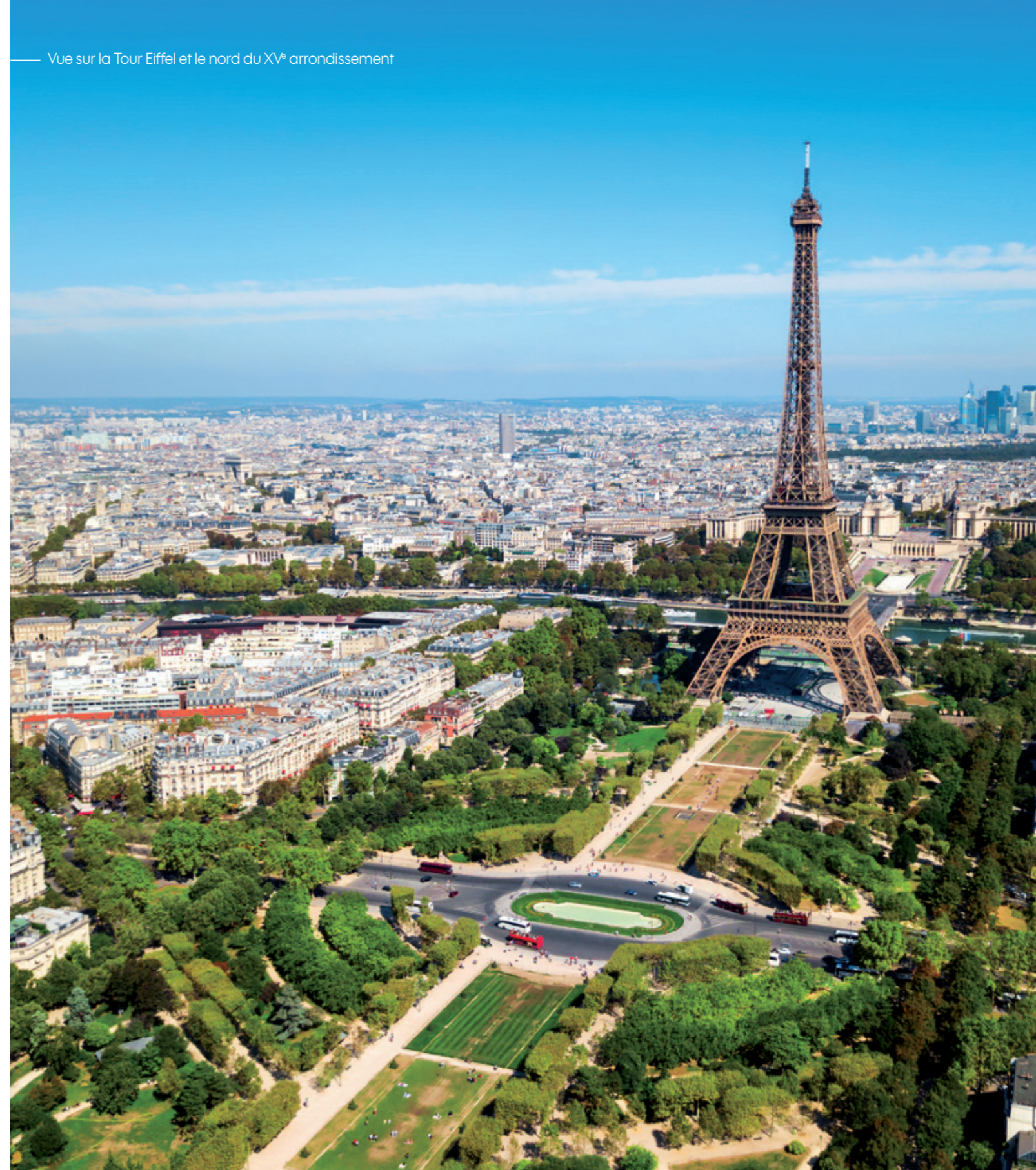
— Vue sur la Tour Eiffel et le nord du XV e arrondissement