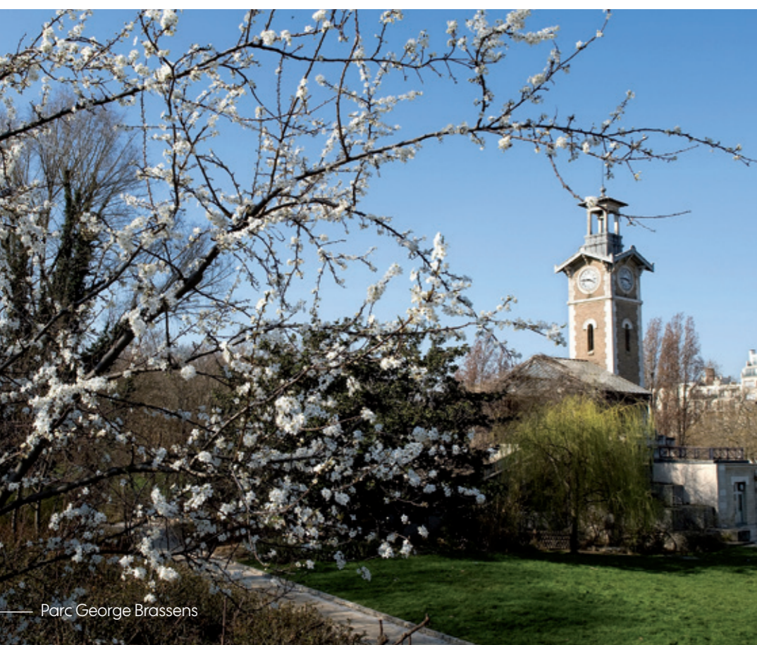
Parc George Brassens