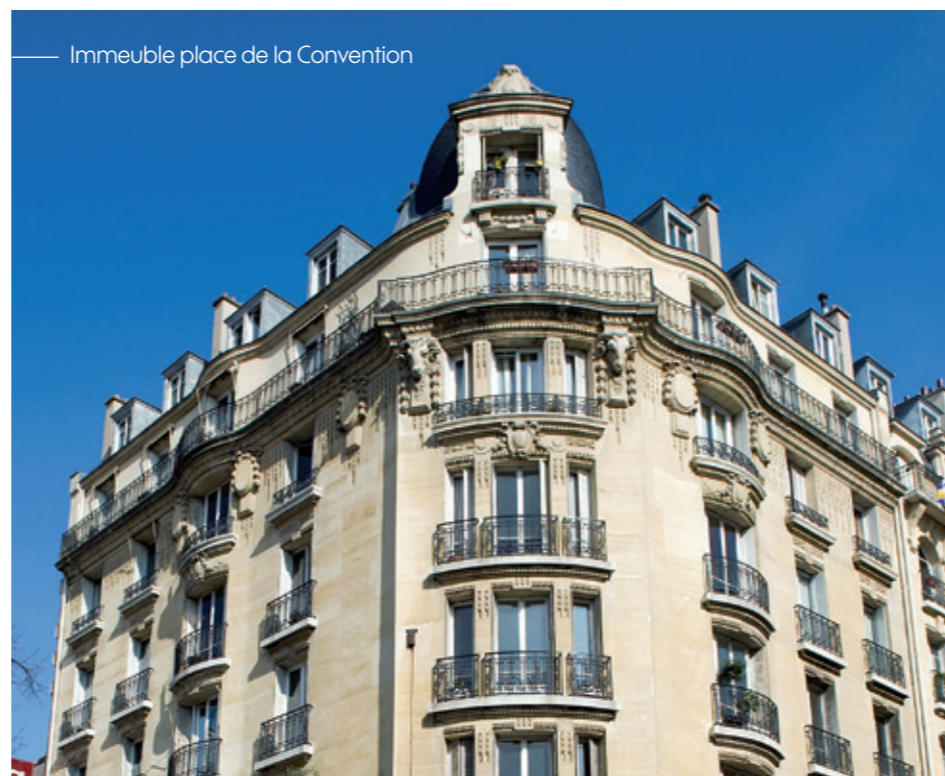
Immeuble place de la Convention