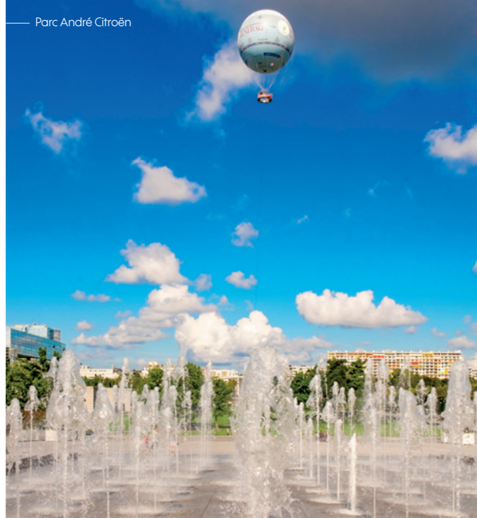
Parc André Citroën