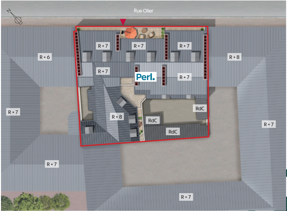
▶ Accès piétons