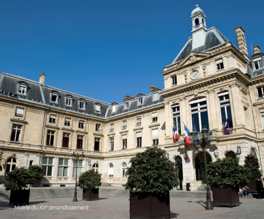
Mairie du XV e arrondissement