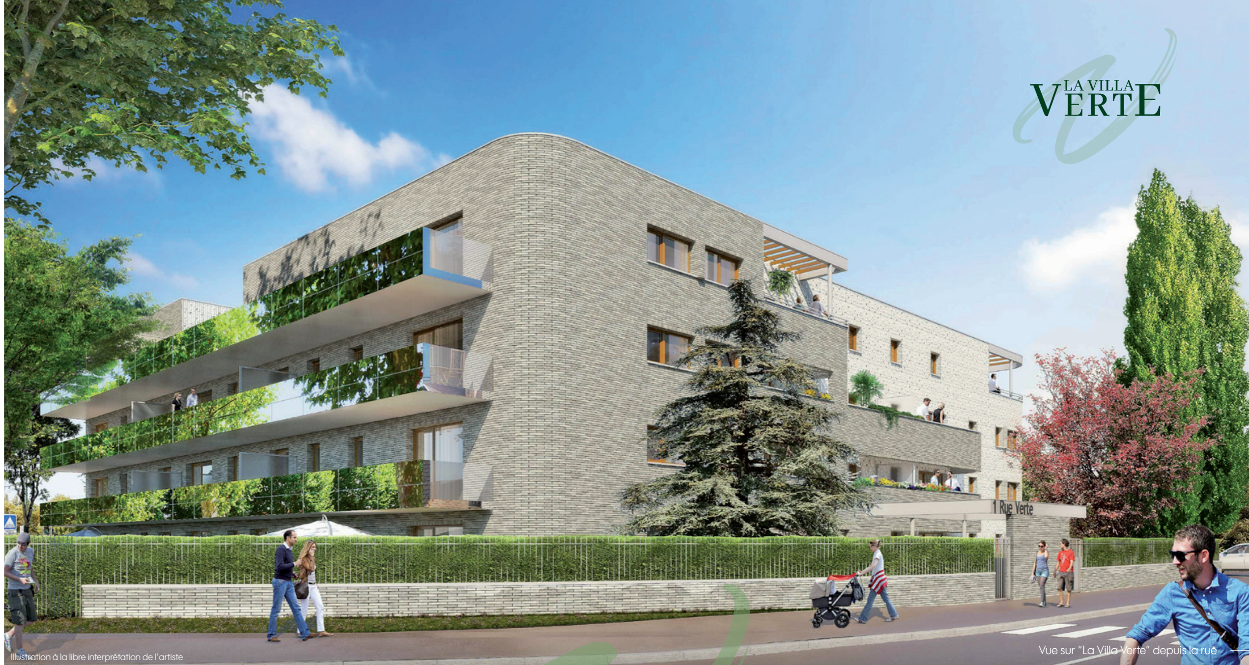
Illustration à la libre interprétation de l'artiste