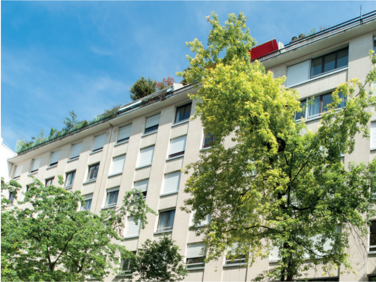
Façade rue Mesnil, cour intérieure et façade rue Saint-Didier