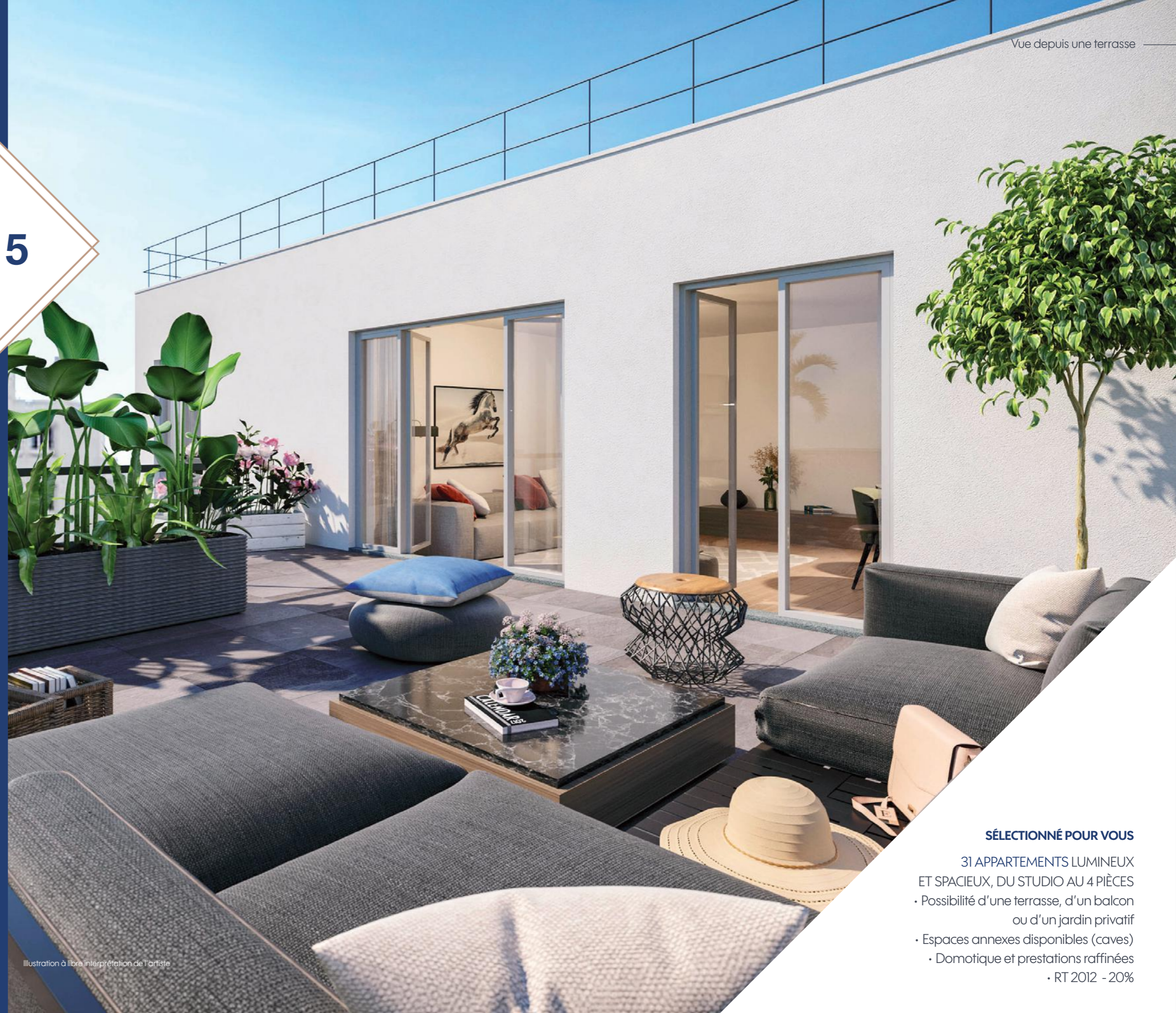
Illustration à libre interprétation de l'artiste