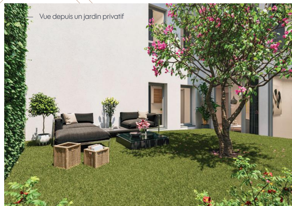
Vue depuis un jardin privatif

Illustration à libre interprétation de l'artiste