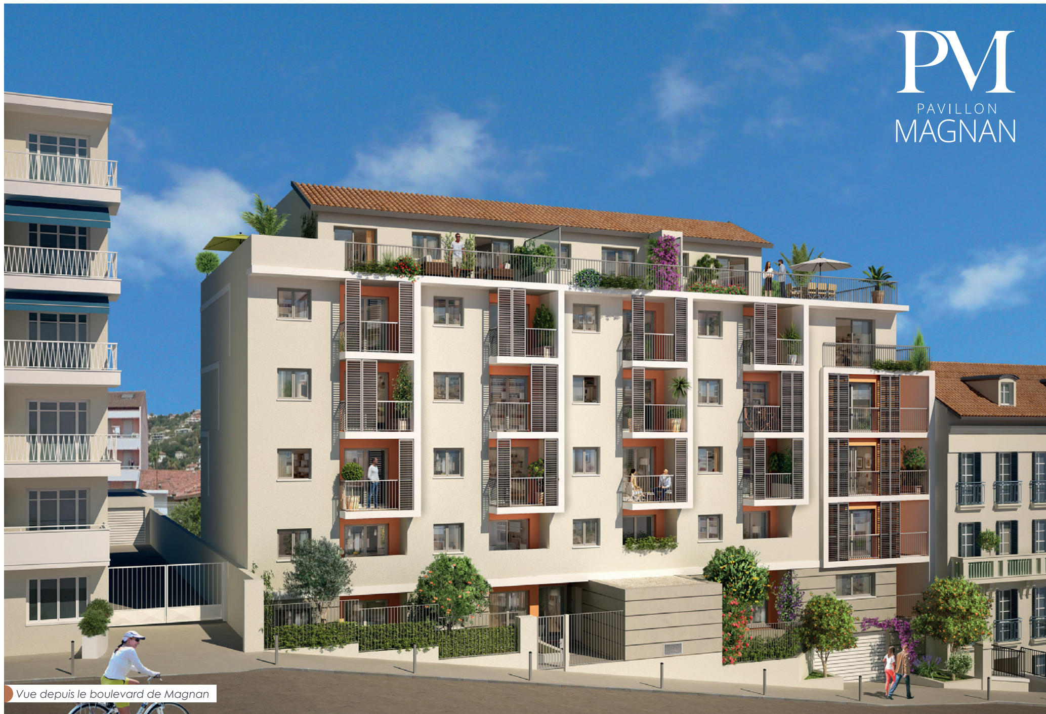
Vue depuis le boulevard de Magnan