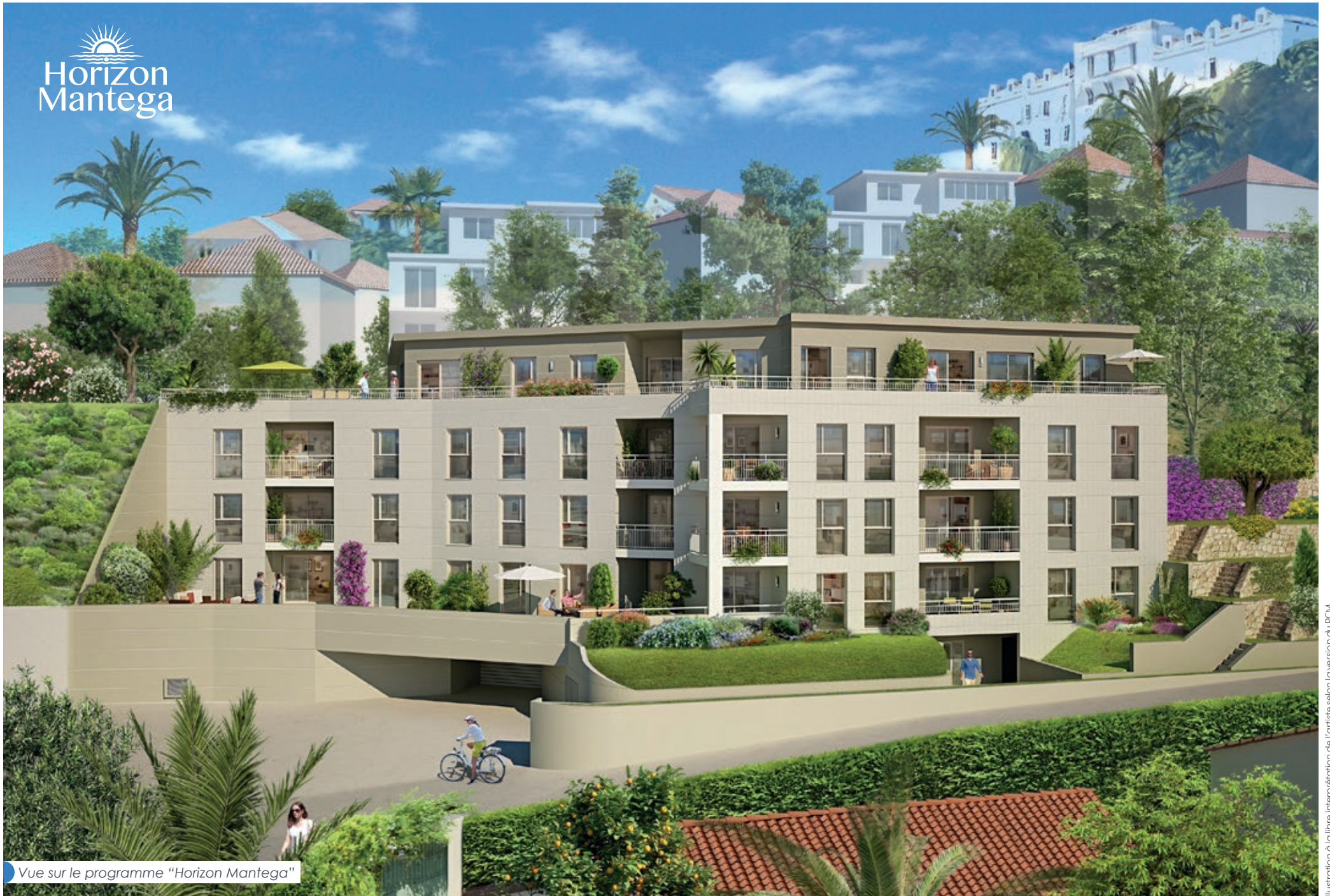
Vue sur le programme "Horizon Mantega"