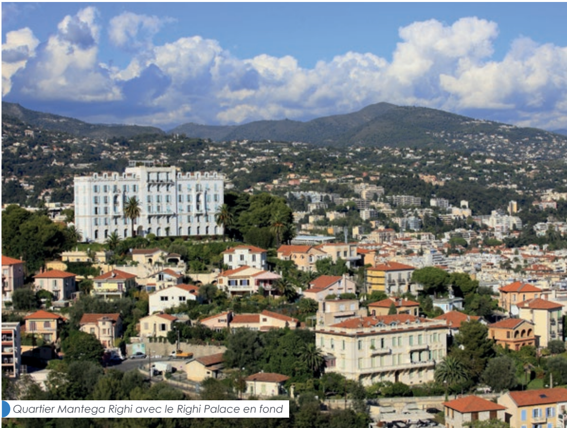
Quartier Mantega Righi avec le Righi Palace en fond

Ce quartier est très recherché pour son standing et sa situation idéale. Situé sur le boulevard Mantega Righi, au-dessus du Parc Impérial et à proximité de l'église orthodoxe russe, "Horizon Mantega" est proche de toutes les commodités et dispose d'une excellente desserte. Son environnement résidentiel, composé de maisons et de bâtiments de style Belle Époque, possède tous les ingrédients d'un quartier d'exception.