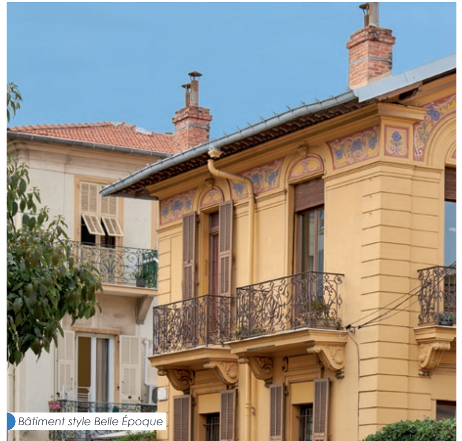
Bâtiment style Belle Époque