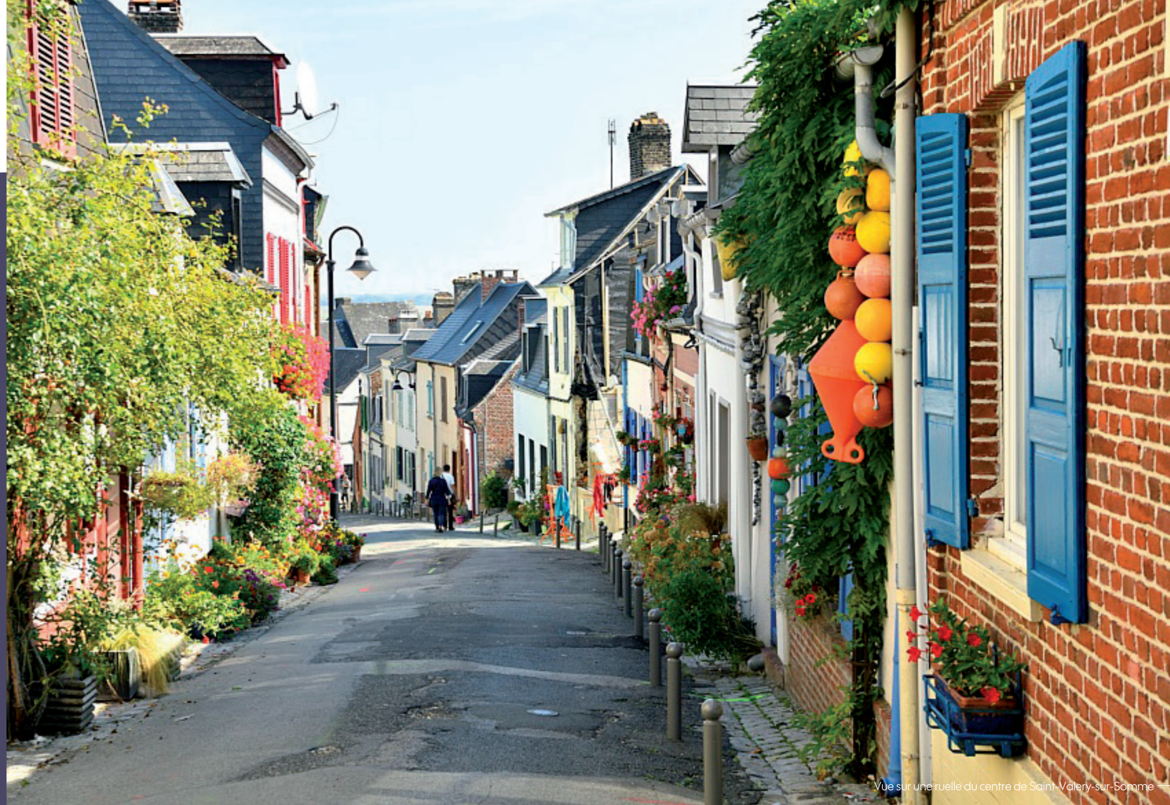
Vue sur une ruelle du centre de Saint-Valery-sur-Somme