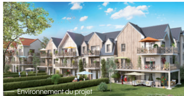
Illustration à la libre interprétation de l'artiste