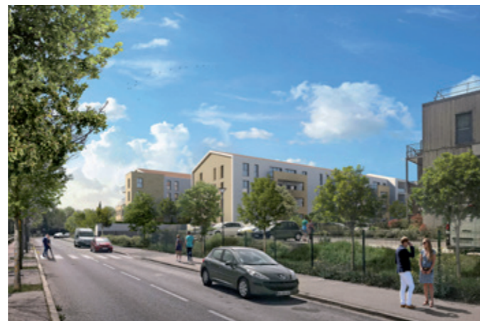
Illustration à libre interprétation de l'artiste