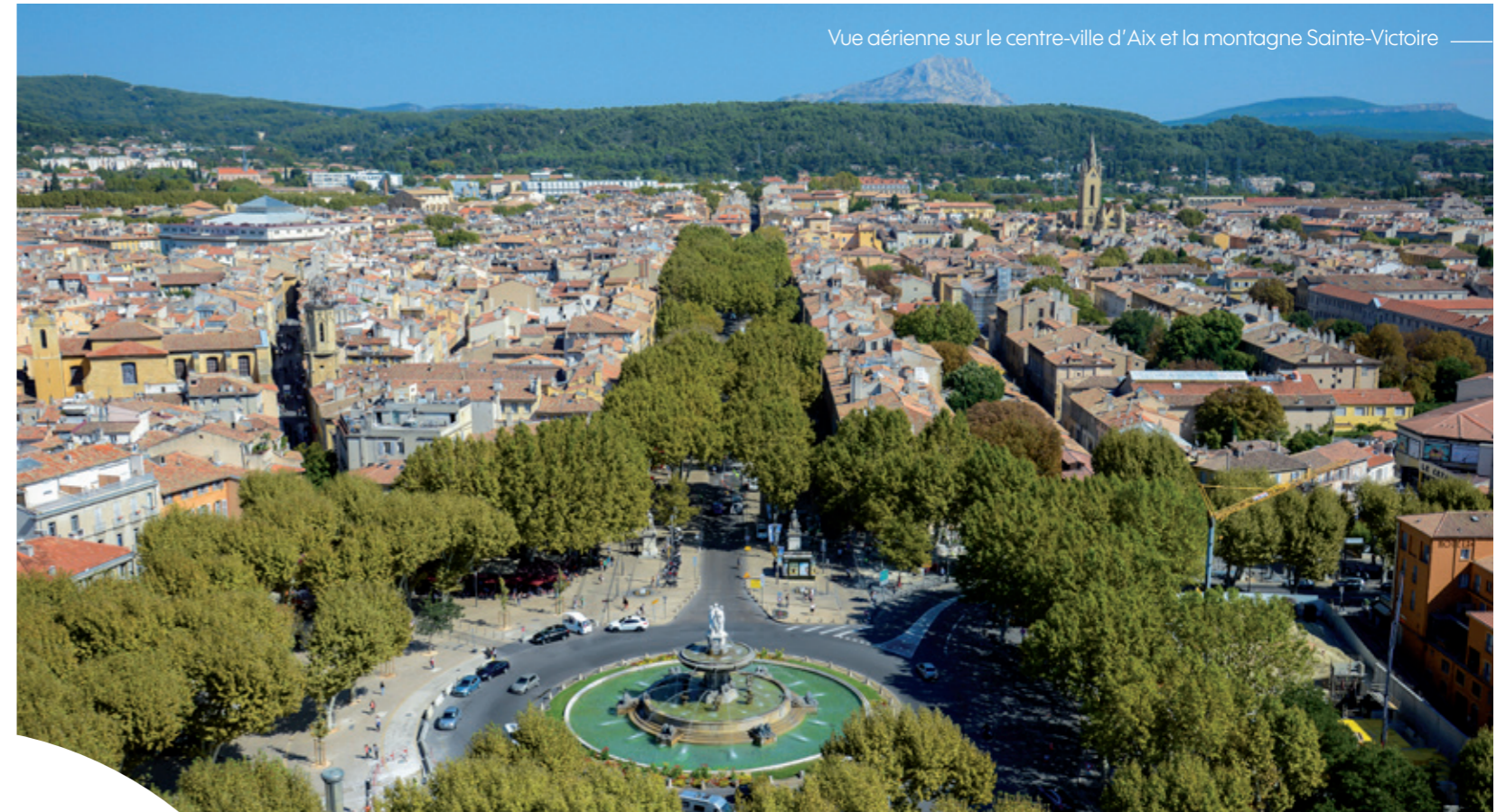
Vue aérienne sur le centre-ville d'Aix et la montagne Sainte-Victoire