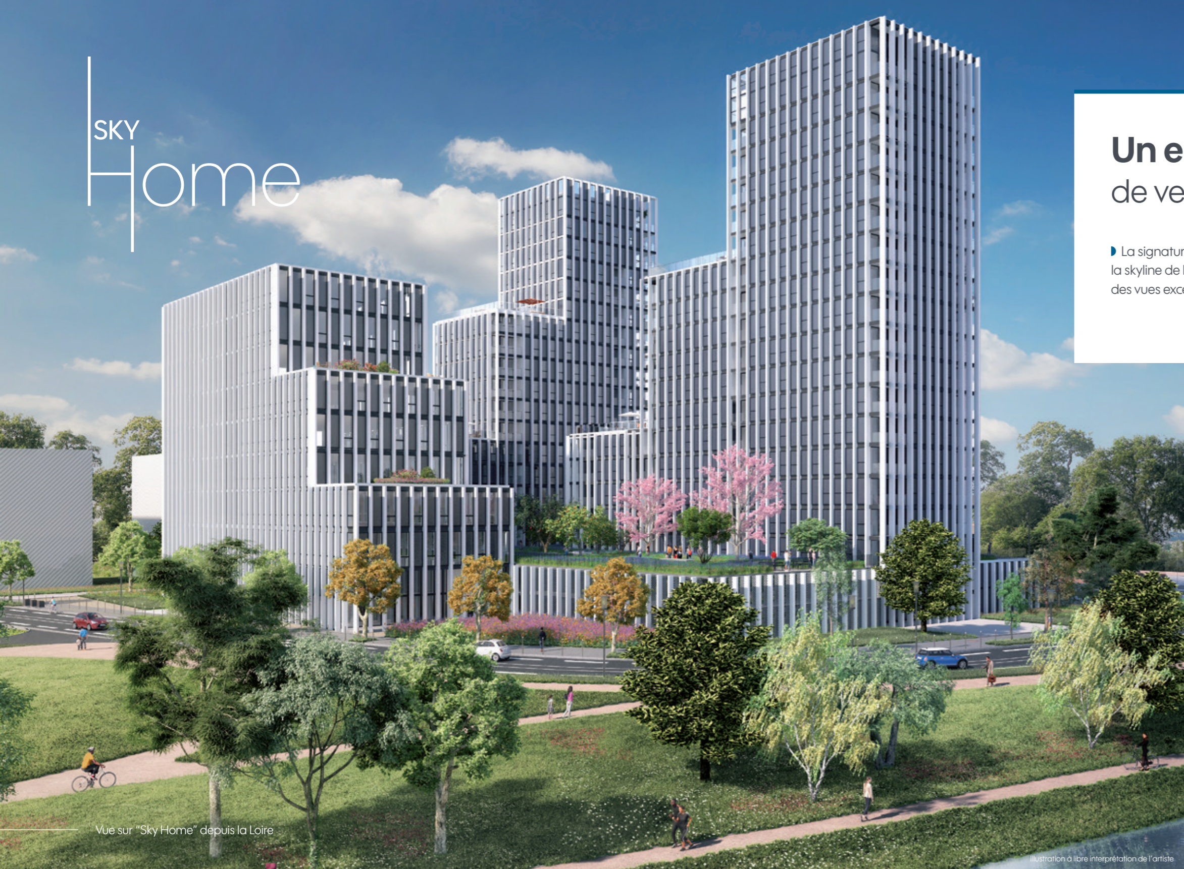
Vue sur "Sky Home" depuis la Loire

Illustration à libre interprétation de l'artiste