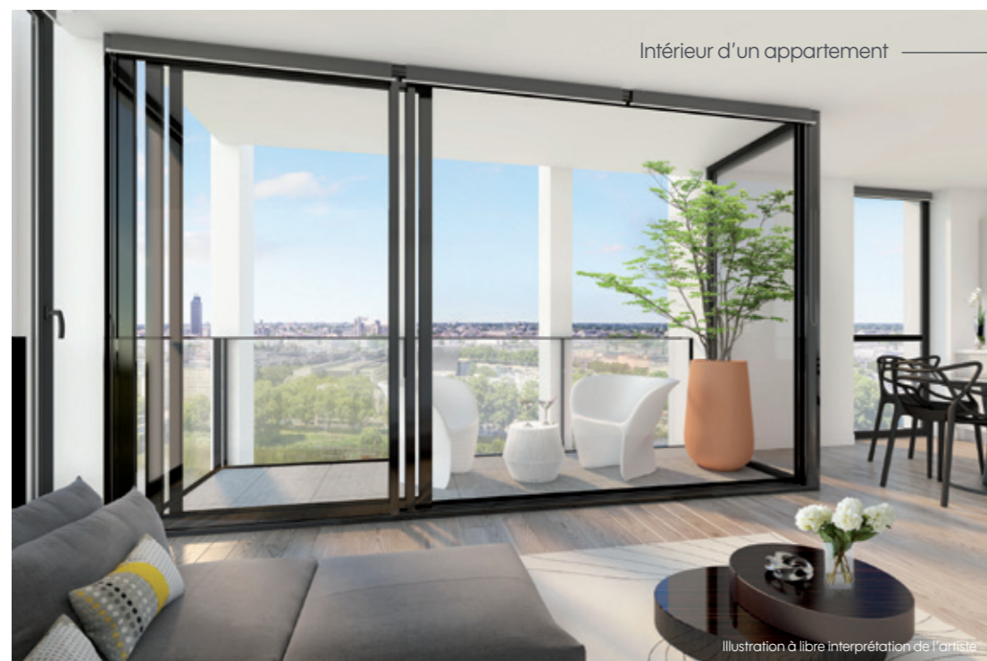
Intérieur d'un appartement

Illustration à libre interprétation de l'artiste