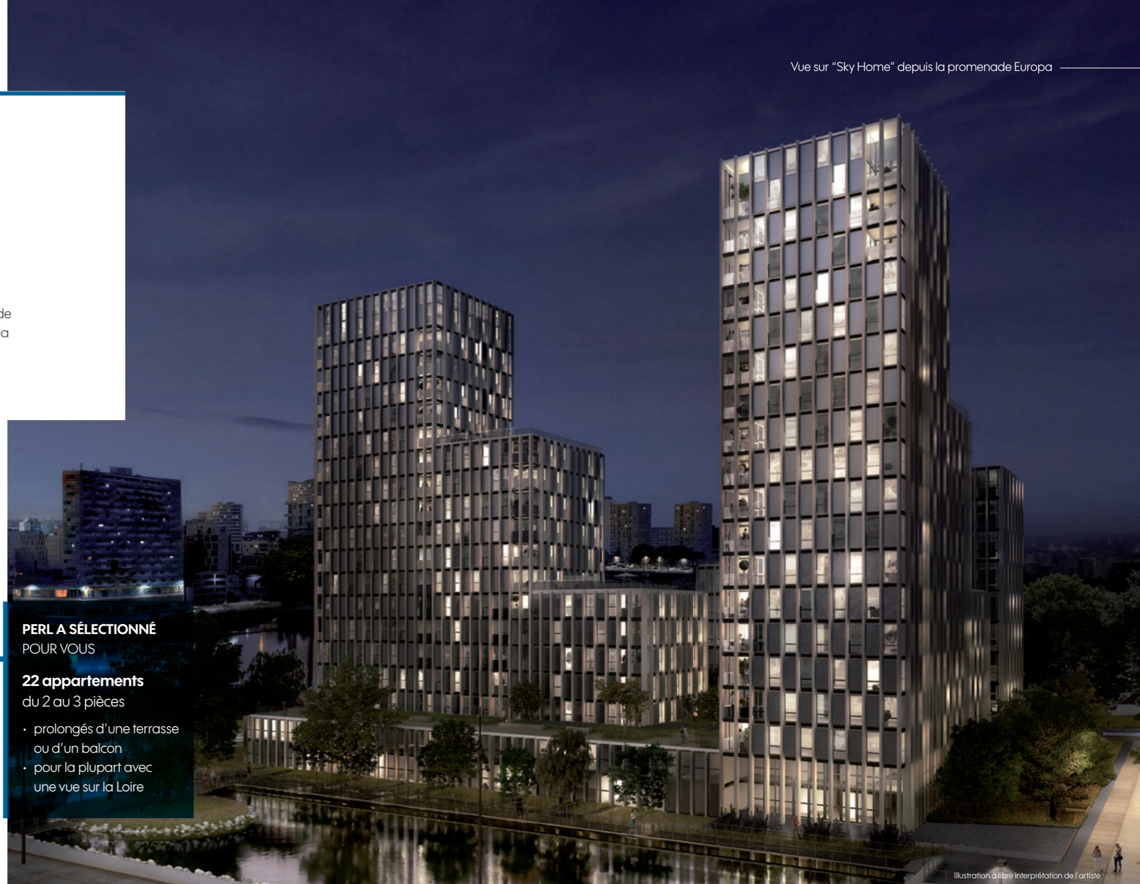
Illustration à libre interprétation de l'artiste