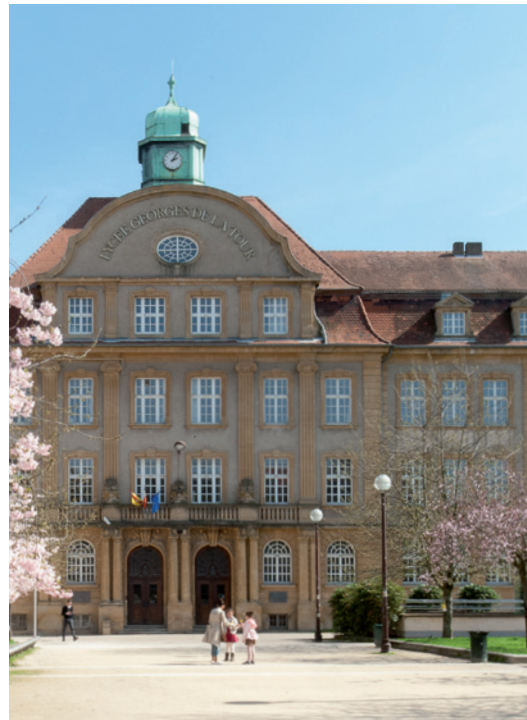
Lycée Georges de la Tour