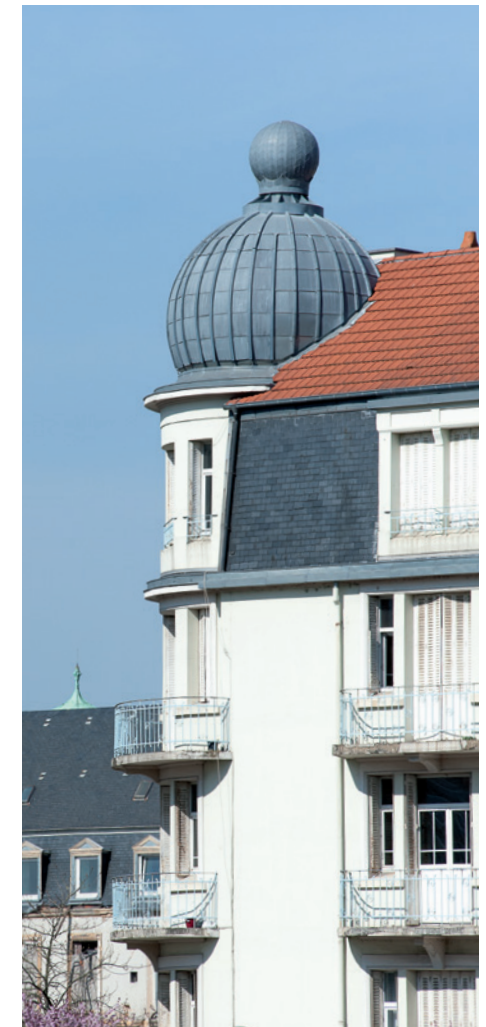
Place Philippe de Vigneulles