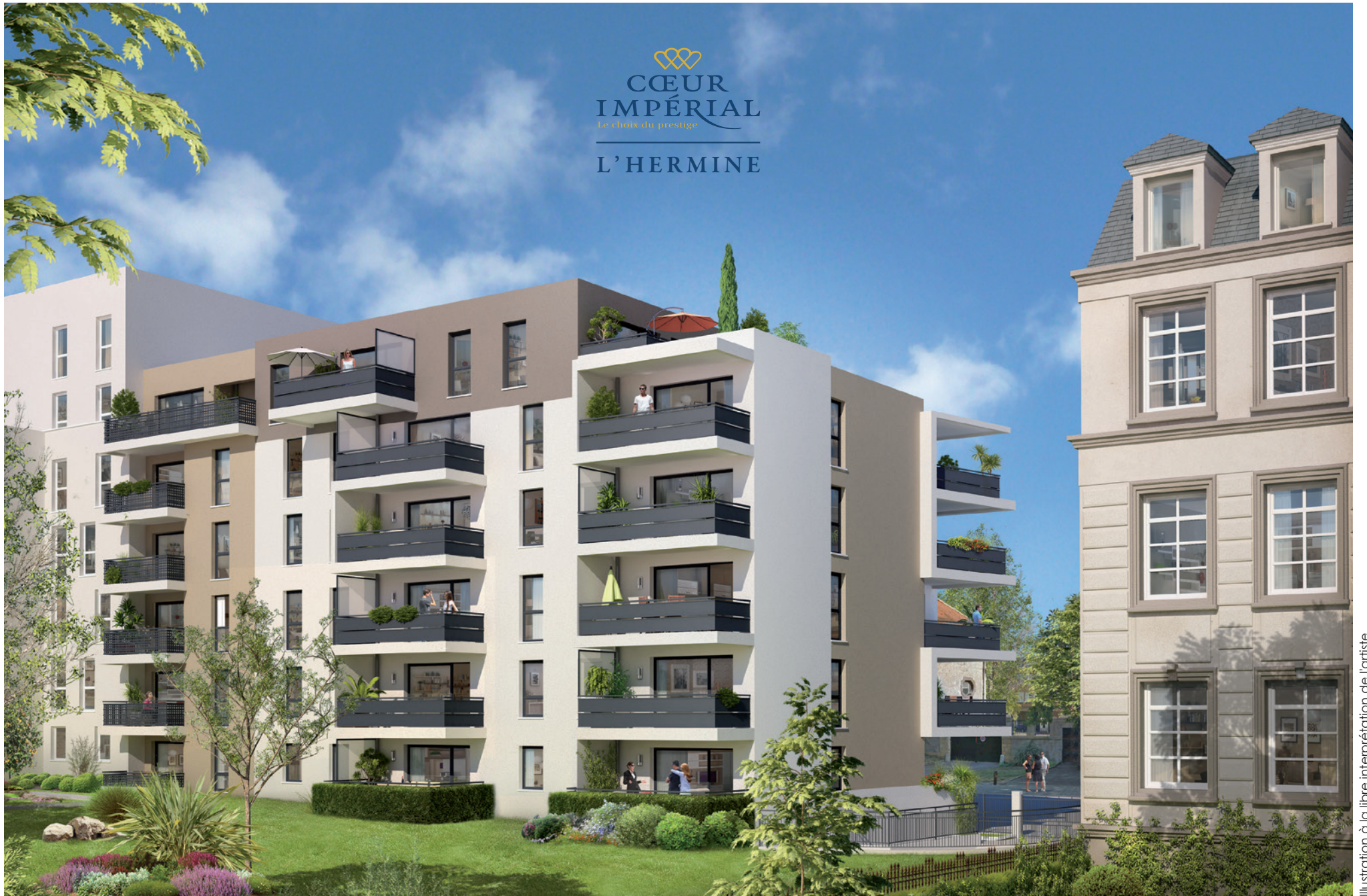
"L'Hermine" vu depuis les jardins de "Cœur Impérial"