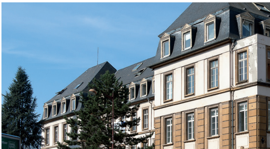
Le bâtiment historique de l'ancien hôpital, conservé dans le projet

Signé du réputé Atelier Lions, un urbanisme novateur, au service de l'art de vivre. Près du bâtiment historique de l'ancien hôpital, "L'Hermine", comme l'ensemble des immeubles de "Cœur Impérial", a été confié à des architectes de renom qui ont créé, grâce à des mixités de hauteurs et un design innovant, un ensemble harmonieux, au caractère affirmé. Respectueux de l'écologie urbaine et à dimension humaine, "Cœur Impérial", à l'image de la cité messine, invite à l'art de vivre.