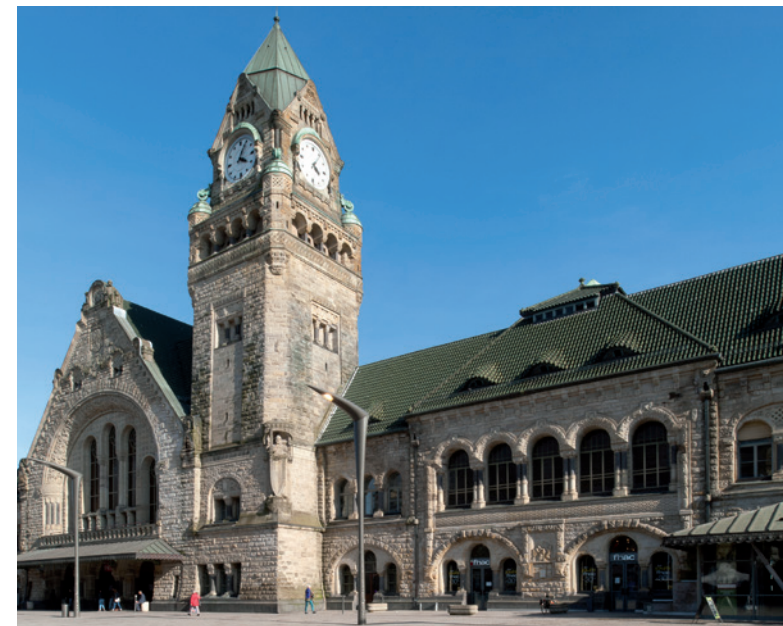
Gare de Metz

En avion : aéroport de Metz-Nancy à 26 km