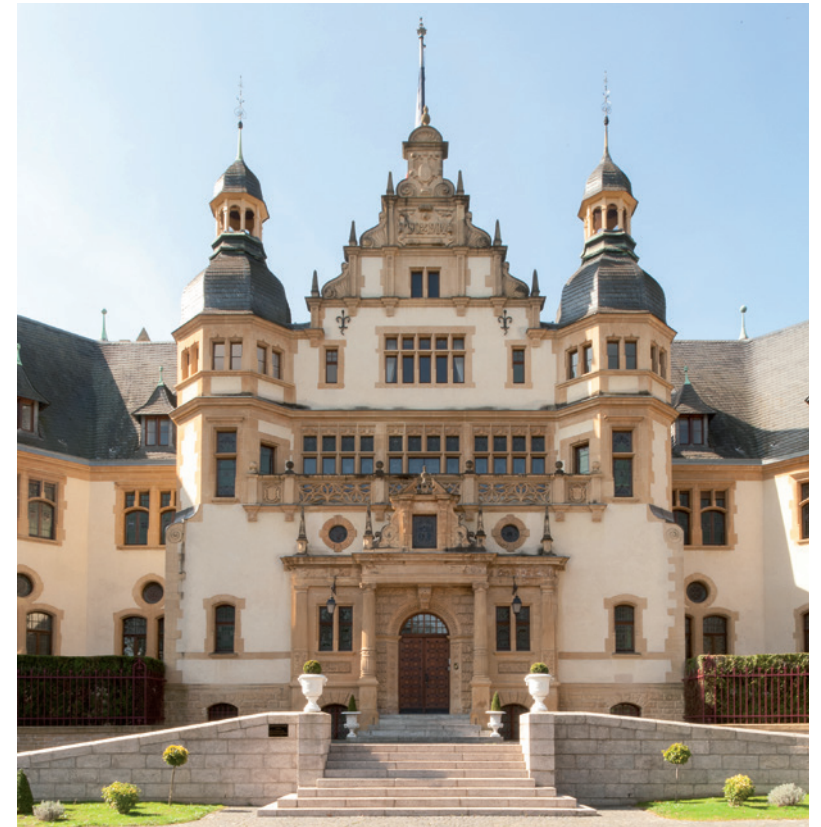
Palais du Gouverneur

Le luxe d'oublier la voiture pour profiter de tous les centres d'intérêt messins