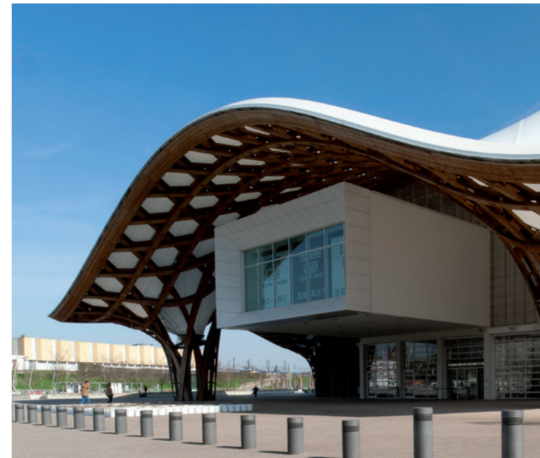
Centre Georges Pompidou-Metz