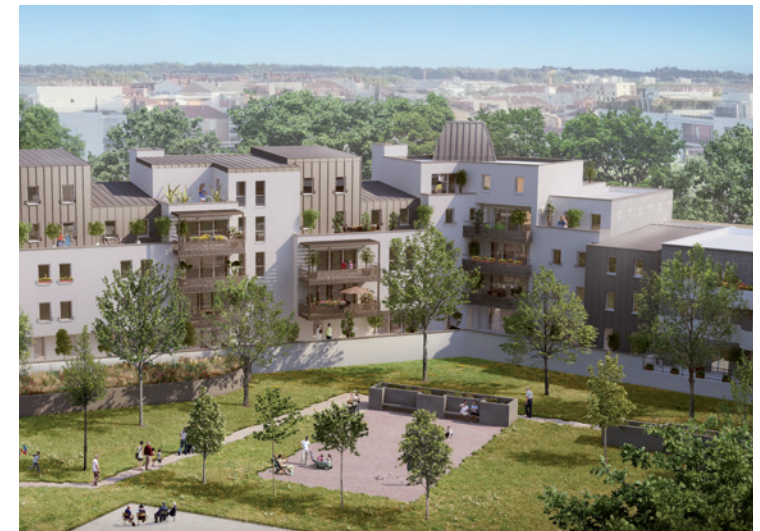
"Le Monarque" et "L'Amiral", 2 immeubles de "Cœur Impérial"