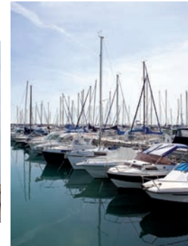
Ruelles ombragées, marina et plage