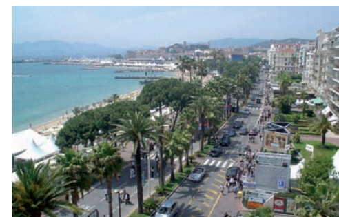
La Croisette à Cannes