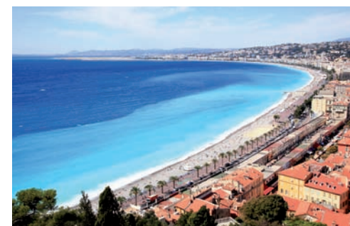
La Baie des Anges à Nice

5260 route de Saint-Jeannet 06700 Saint-Laurent-du-Var