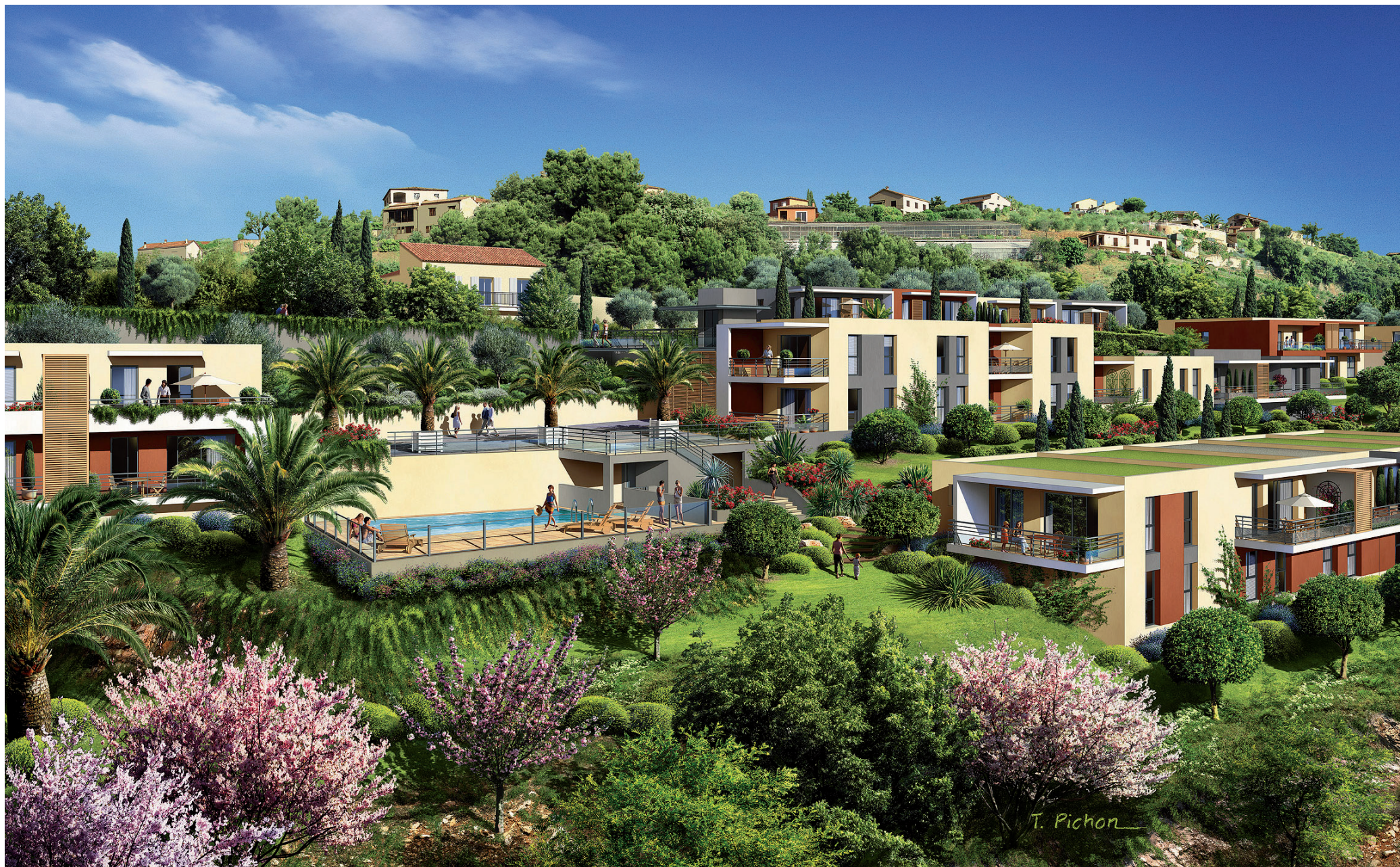
Illustration à la libre interprétation de l'artiste.

Un domaine préservé, un parc classé de 1,5 hectare