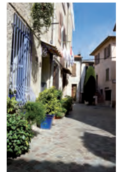
Saint-Laurent-du-Var : le front de mer et le centre du village