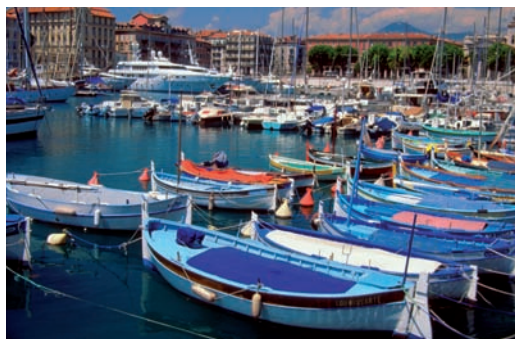
Nice : la Promenade des Anglais, le port de plaisance et le centre-ville