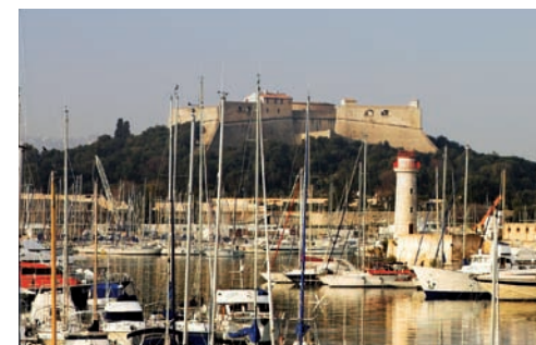
Le fort Vauban d'Antibes