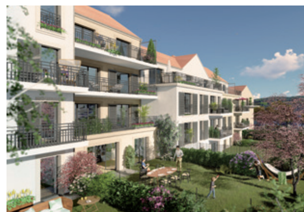
Illustration à libre interprétation de l'artiste