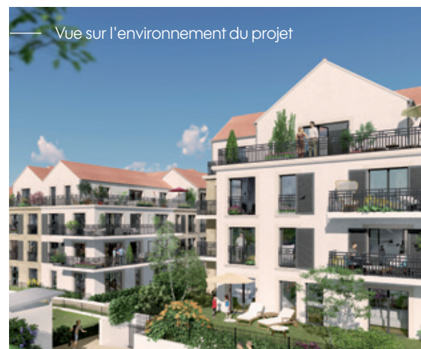
Vue sur l'environnement du projet