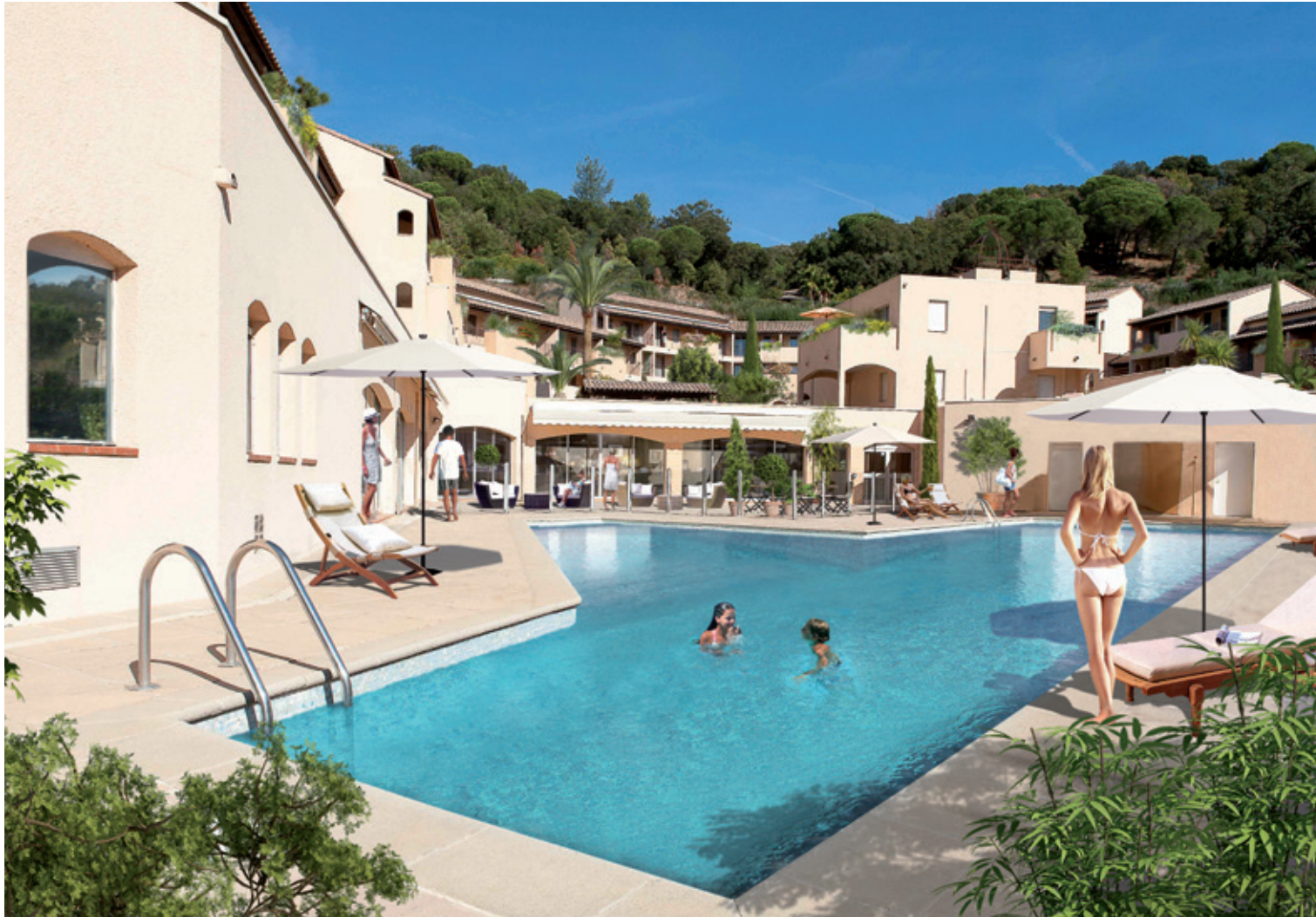
Illustration à la libre interprétation de l'artiste

Niché dans les collines surplombant La Croix Valmer, au sein d'un quartier résidentiel calme et verdoyant, "Grand Cap" est une architecture d'inspiration méditerranéenne dont les bâtiments forment un cirque autour d'une grande piscine centrale. La rénovation des parties communes et privées de cette propriété va permettre de créer des appartements de standing s'ouvrant sur un magnifique panorama.