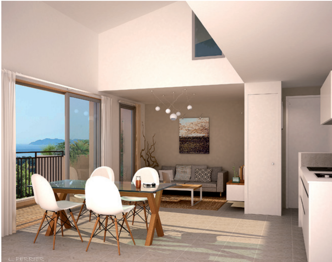
Illustration à la libre interprétation de l'artiste

Profitant de belles expositions sud / sud-est, les appartements sont prolongés de terrasses entourées de verdure et offrent pour certains de superbes vues dégagées sur les collines et la Méditerranée.