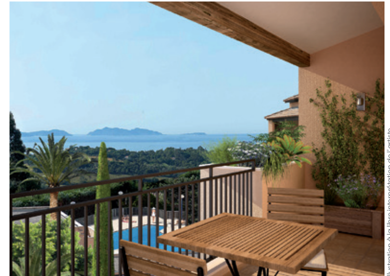
Illustration à la libre interprétation de l'artiste