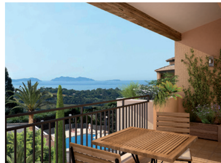
Illustration à la libre interprétation de l'artiste