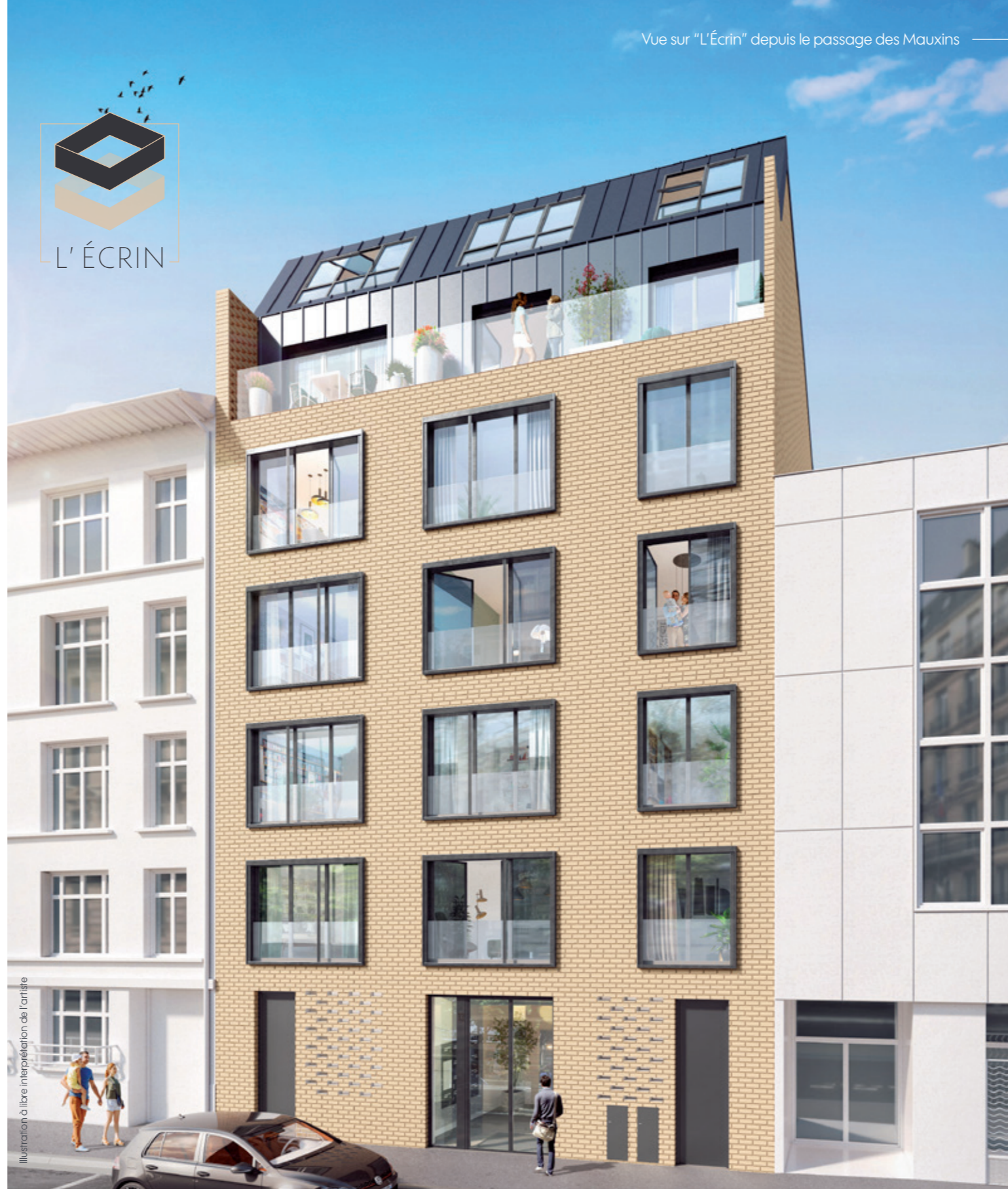
Illustration à libre interprétation de l'artiste