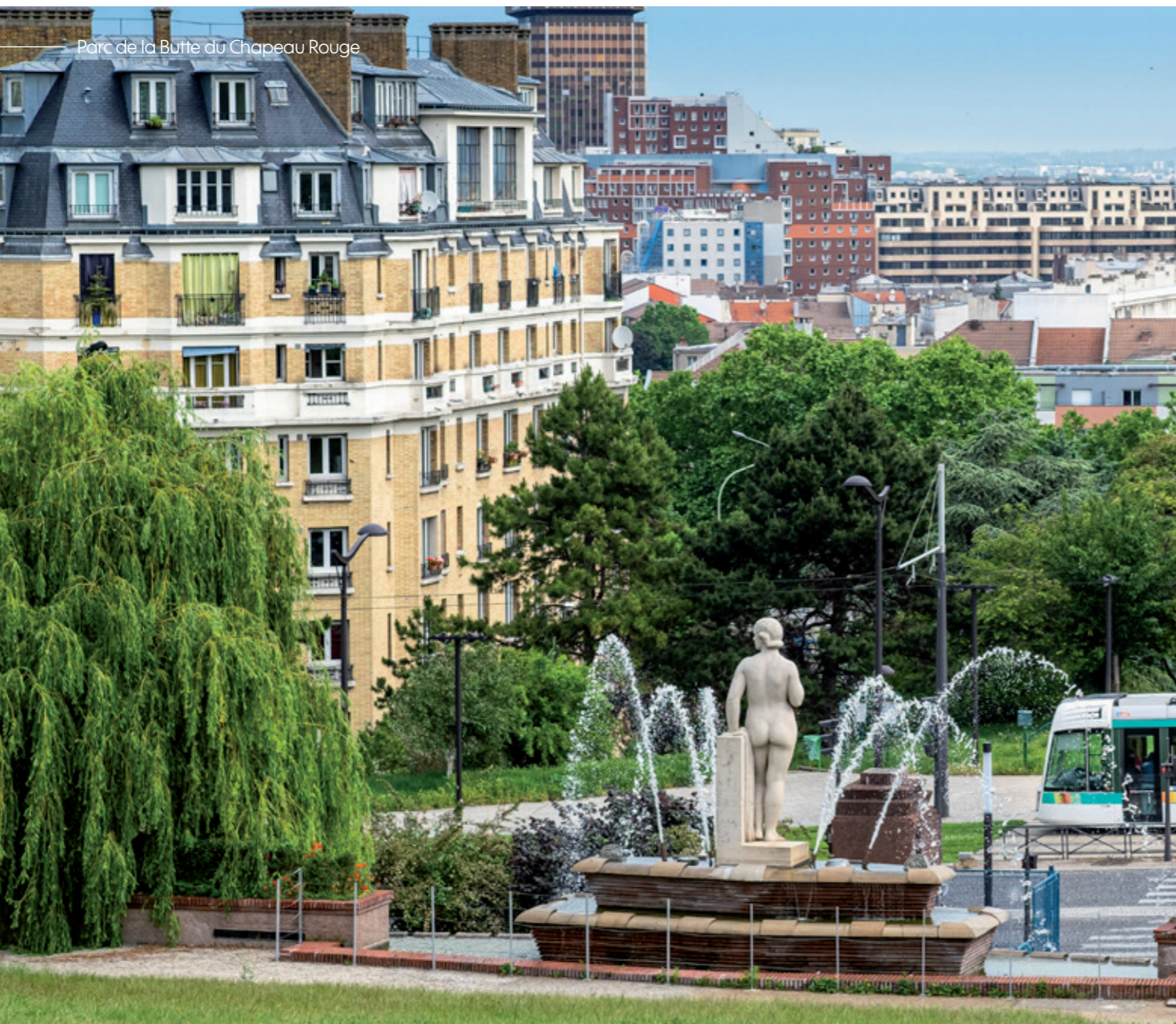
Parc de la Butte du Chapeau Rouge