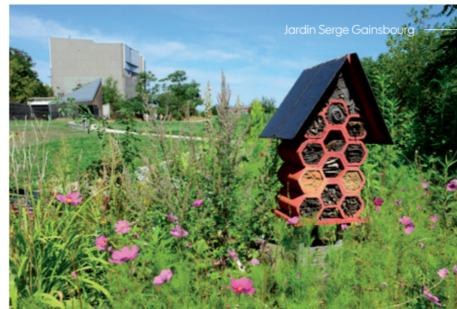
Jardin Serge Gainsbourg