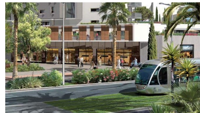
La future ligne de tramway

A proximité des écoles, collèges et lycées, West Parc s'ouvre sur une vaste esplanade piétonne arborée, avec, en rez-de-jardin des commerces de proximité.