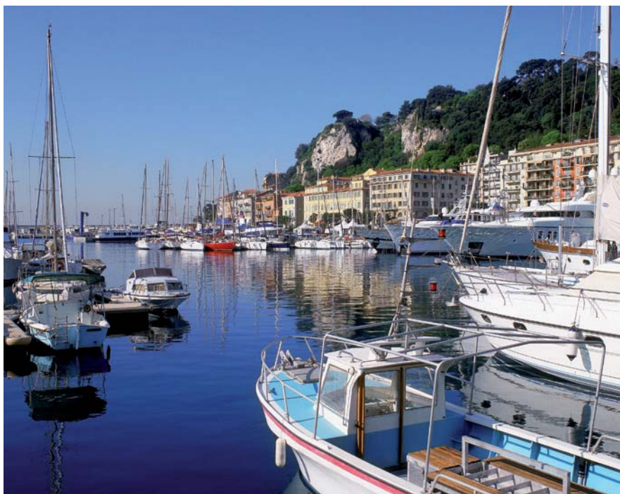
Port de Nice