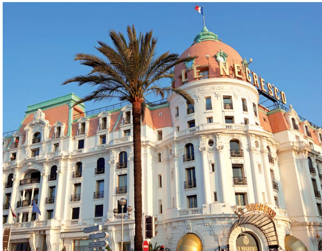
Palace Le Negresco