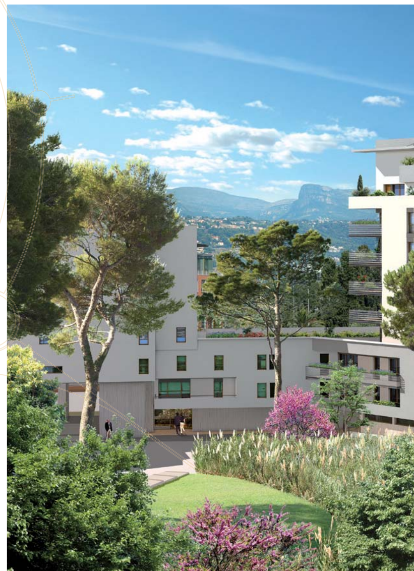
Le jardin intérieur (au second plan les bâtiments F et G)

L'éco-conception de West Parc vous garantit une haute performance énergétique, notamment grâce à une isolation optimisée et une orientation favorisant la lumière naturelle.