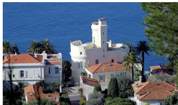
Villas en bord de mer