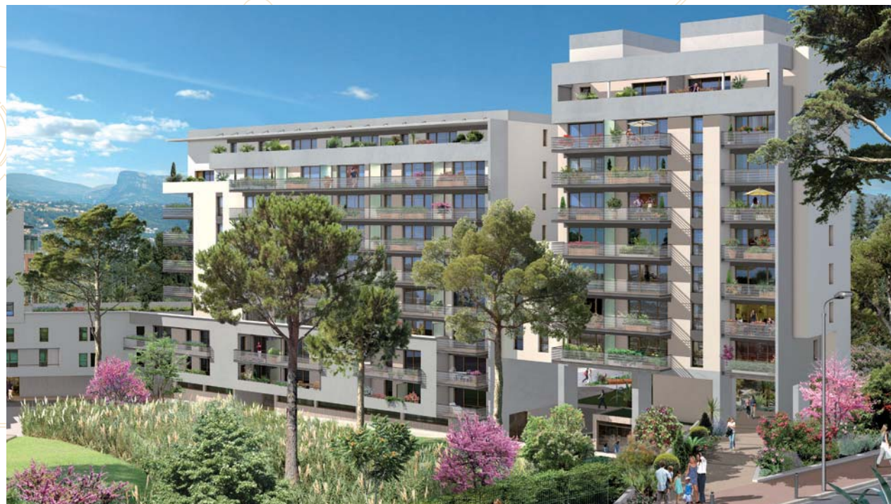
West Parc, vue sur le bâtiment G

Orientée sur l'innovation et la croissance verte, la technopole accueillera entre autres l'Institut Méditerranéen des Risques, de l'Environnement et du Développement Durable, un éco-campus, le Centre des entreprises innovantes, des business centers et incubateurs d'entreprises, avec 4 000 emplois prévus dès son ouverture.