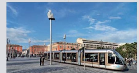
Tramway, place Massena