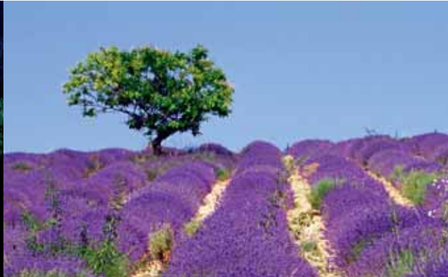
Rangs de lavande