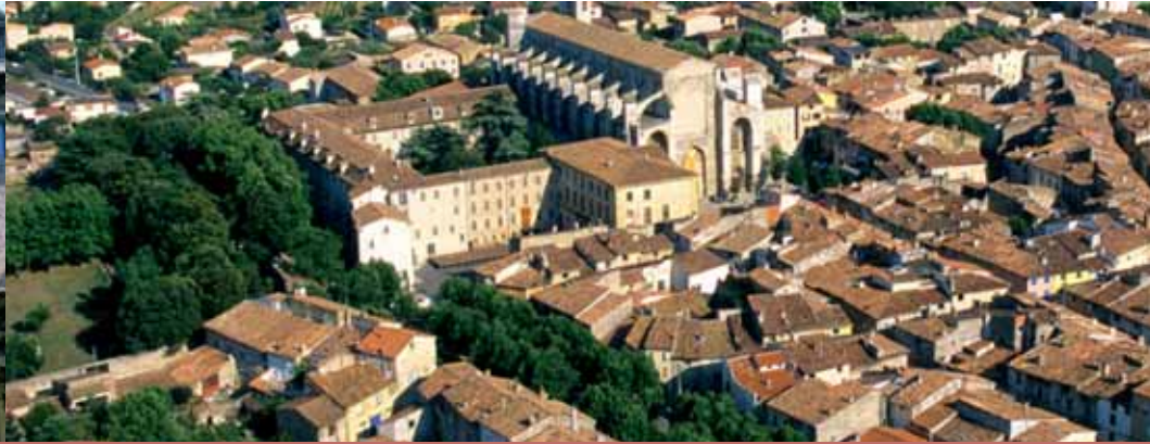
Vue aérienne de Saint-Maximin