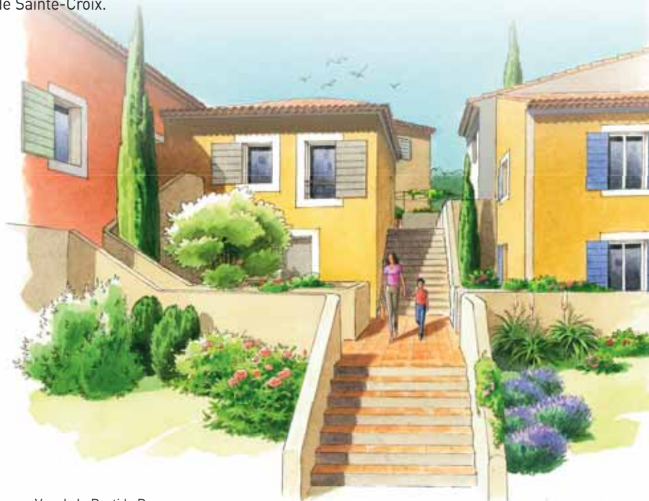
Vue de la Bastide D

LES MAS DE LA SAINTE BAUME constituent un investissement de qualité, dans un cadre de vie en harmonie avec les richesses naturelles et architecturales de son environnement.