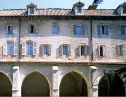
Basilique de Saint-Maximin