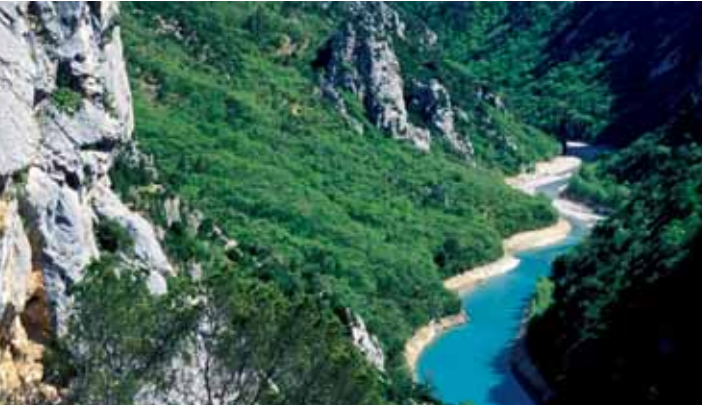
Les Gorges du Verdon